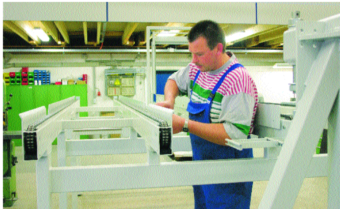
Ein Tegel-Mitarbeiter bei der Montage.

Firmenphilosophie: „Qualität leben wir täglich.“ In der Unternehmenskultur sind der „Respekt vor Kunden, Mitarbeitern und Lieferanten“ als Grundwerte der Gesellschaft festgeschrieben. Jeder Einzelne trägt Verantwortung für sein Handeln. Dass diese Prinzipien gelebt werden, macht Tegel an der Firmentreue seiner Mitarbeiter und an der Zufriedenheit seiner Kunden fest, „die vor allem unsere Termintreue schätzen und zur kontinuierlichen Geschäftsentwicklung der letzten zwei Jahrzehnte beigetragen haben“.