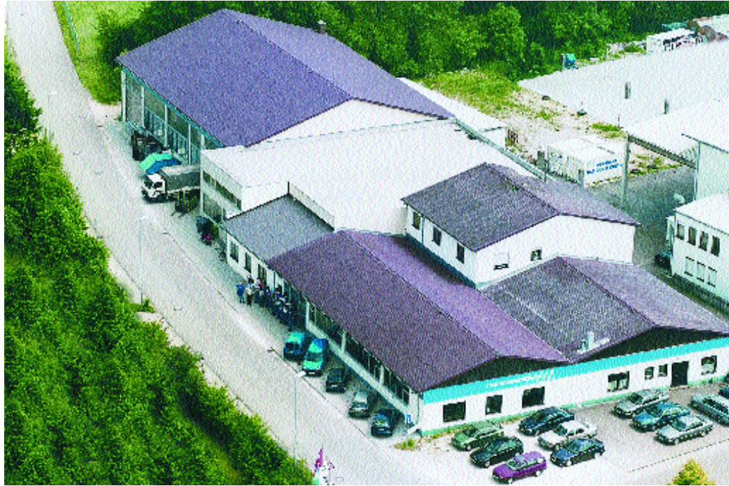
Das Firmenareal der Tegel-Technik in der Siemensstraße in Giengen an der Brenz.